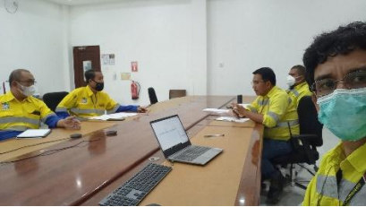
Arrange PJO Evaluation by KTT Toka 2021