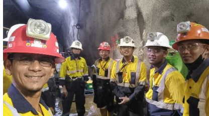
Audit SMKP UG Drilling Site BSI Tujuh Bukit 2022