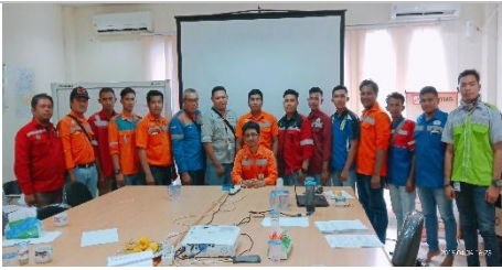
Carried out Investigation Training in BIB 2018 Angsana