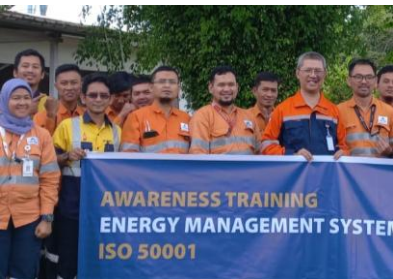
ISO 50001 Awareness at Martabe 2023