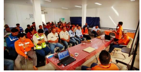
Arrange safety committee in BIB 2019 Angsana