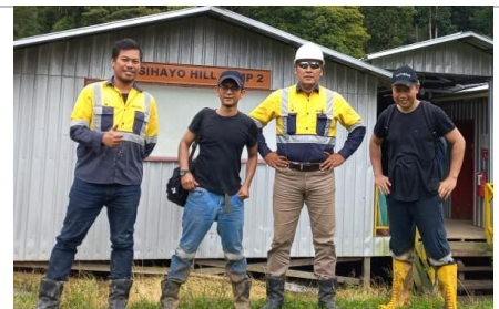
6 hours walking to Sihayo Hill, Carried out field audit SMKP in Sorikmas Mining 2021