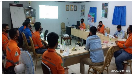
Leads Audit SMKP for PPA - BIB Angsana 2020