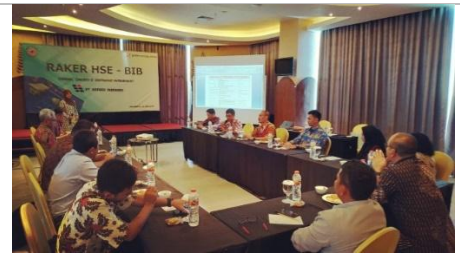
Raker HSE Sinarmas 2019 in Banjarmasin