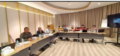
Meeting CMS Procedure with HSE Sinarmas – Jakarta 2018