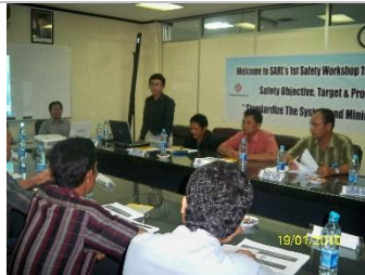
HSE Workshop in Straits Asia 2009 Balikpapan