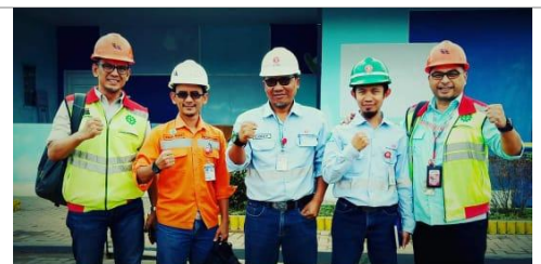
Kunjungan ke PPA Site BIB dalam rangka seleksi pengawas dan rencana program leadership change management dari GEMS / (Sinarmas Mining) 2019