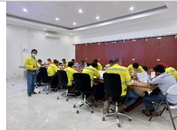
Conduct safety training in MSM Toka 2021