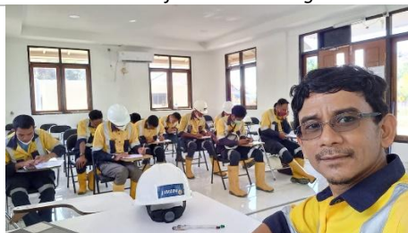
Carried out Hazard Identification Training for tim Drilling in Hu'u STM 2022