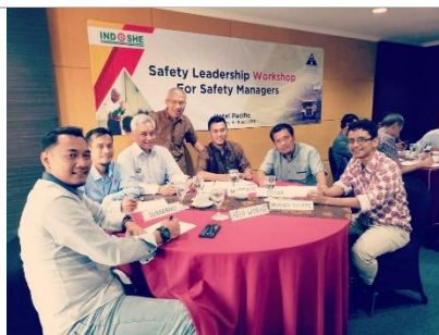
Workshop terbatas Safety Leadership for Safety Manager by INDOSHE di Balikpapan 2023